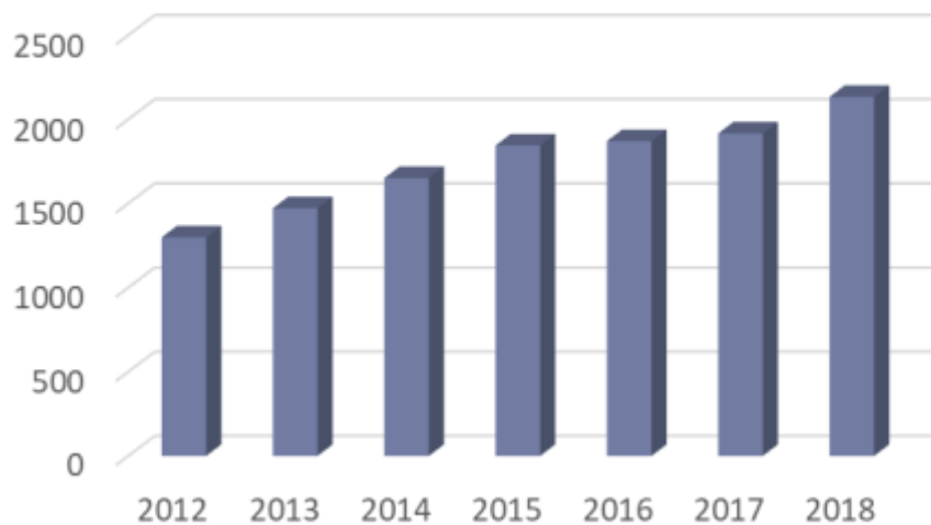
Árbevétel (millió HUF)